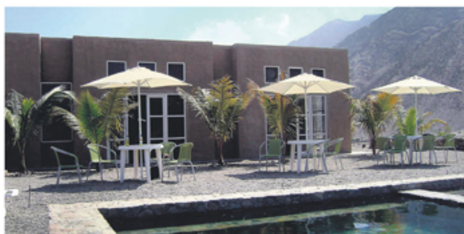
El precio de un terreno de 1,000m 2 en Condominio Las Bahías bordea los US$ 25,000.

✖ El proyecto, con una inversión de US$20 millones, ha sido diseñado bajo un concepto ecológico, sembrando en cada lote un cerco vivo. Este contará con centros deportivos, salas de meditación, un hotel, entre otros.